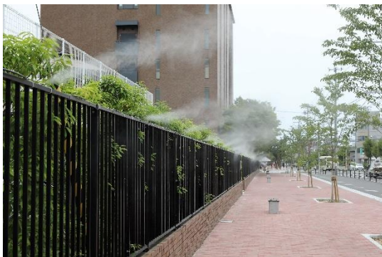
ミスト散布の様子。ここに太陽光パネルで発電した電気が活用されています。

設置後、同大学にて施設のお披露目会が開かれました（2019年6月18日実施）。この日は大阪北部地震からちょうど1年ということもあり、この場所の開設で改めて防災意識を高める機会にしていきたいという学長からのご挨拶もありました。エコスタイルも、大阪府と提携しこのような取り組みを続けていくことで、再生可能エネルギーの普及だけでなく、地域の方への環境、減災への意識を高める活動を行ってまいります。