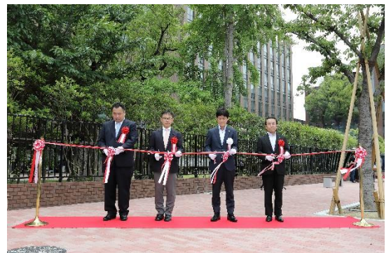
関係者によるテープカットの様子